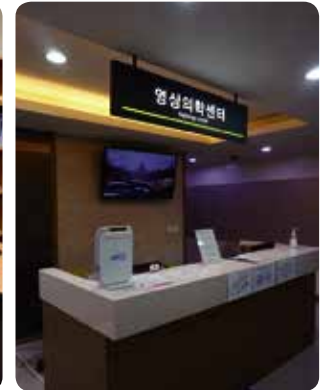
En la sala de Espera