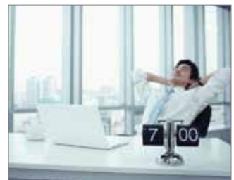
Para aquellos que pasan muchas horas de exposición en hospitales y escuelas