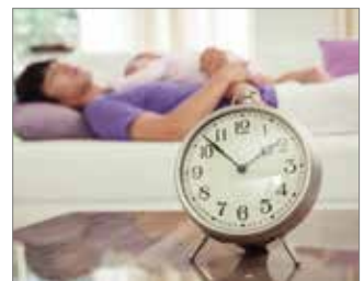
Aquellos que desean disponer de un aire purificado 24/7 sin preocuparse de riesgos