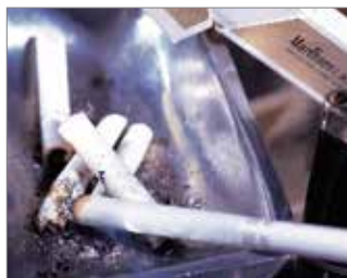
Aquellos que sufren con los malos olores de tabaco y comida