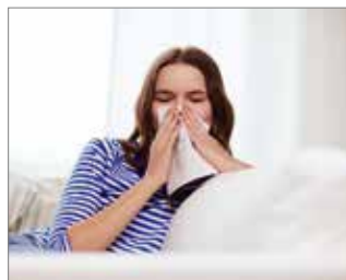
Aquellos que sufren de dermatitis atópica, asma o todo tipo de alergias