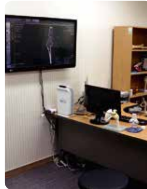
En la Oficina del Doctor