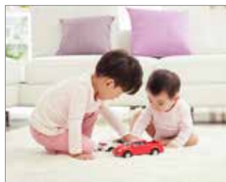
Bebés y mayores con sistemas autoinmunes débiles