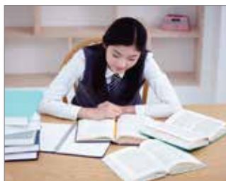
Para estudiantes que necesitan de cuidados especiales de salud